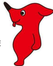
チーバくん 千葉県許諾第A1129-2号

6月開始のプロジェクトです。県内の高校・大学・専修学校の教育機関の皆様、ぜひご活用ください。